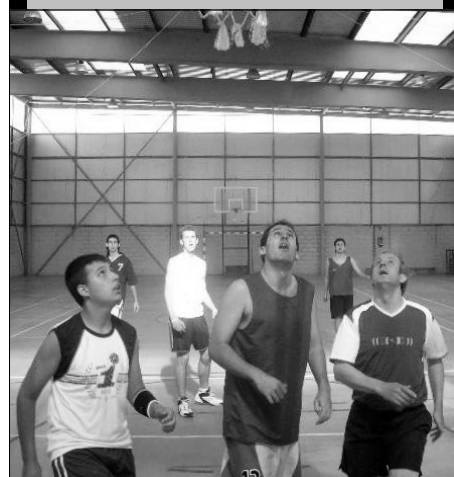
Se hizo lo que se pudo...

La representación del profesorado sufrió de los antiguos alumnos los marcajes más férreos.