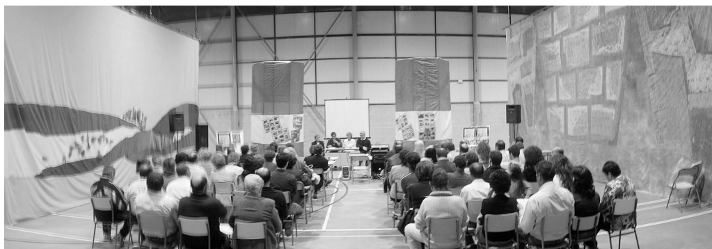
Un momento del acto inaugural en el pabellón del Centro.

El colegio Embajadores se ha vestido de gala para festejar su aniversario. Los distintos acontecimientos culturales se iniciaron en el mes de Abril con un acto inaugural que sirvió de reconocimiento a las AMPAs, consejos escolares y equipos directivos que han formado parte del centro a lo largo de estos años. Durante el acto se presentó el cartel conmemorativo y el programa de actividades que se desarrollarían a lo largo del mes de Mayo. Una secuencia de diapositivas ilustró un recorrido por estos 25 años y dio pie a la conversación y al recuerdo.