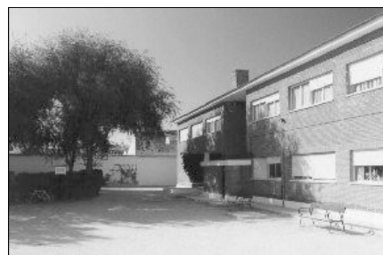
Vista desde el patio

Para el año 1981 se construyó el centro que básicamente hoy conocemos dejó de depender del colegio Dña. Crisanta y pasó a ser Colegio Embajadores. A partir de ese momento, septiembre del año 1.981, comenzaron a impartirse las clases de preescolar (4 y 5 años).