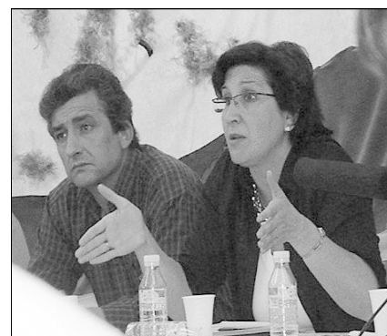
Maribel moya, directora del Instituto de la Mujer de Castilla la mancha

Con una afluencia de público aceptable y un ambiente participativo, destacamos el interés y la valoración positiva que de las reflexiones llevaron a cabo los asistentes, en su mayoría mujeres y esperamos haber servido