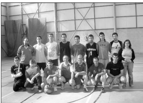
Profesores y antiguos alumnos

El pasado día 26 de mayo celebramos en el pabellón del colegio unos partidos de balon-