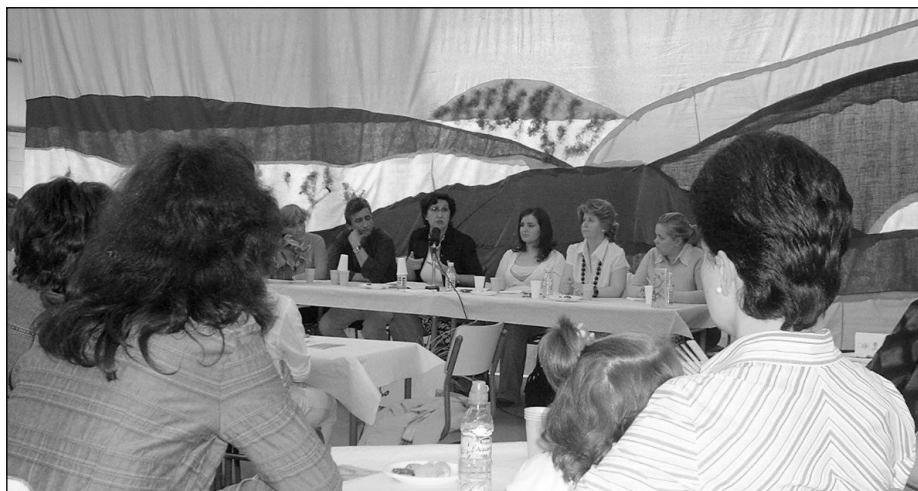
El café coloquio reunió a un nutrido grupo de mujeres

A esta realidad, la Directora, indicaba las alternativas posibles . Por un lado la importancia de la formación y por otro: “la conciliación familiar que haga