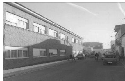
Vista de la fachada del Centro.

Posteriormente pasaron a depender del colegio Dña. Crisanta y hacia el año 1970/1, con la reforma de la primaria a la E.G.B., fueron reconvertidas en clases, y en el patio se construyó un aulario con cuatro de las llamadas "cerilleras".